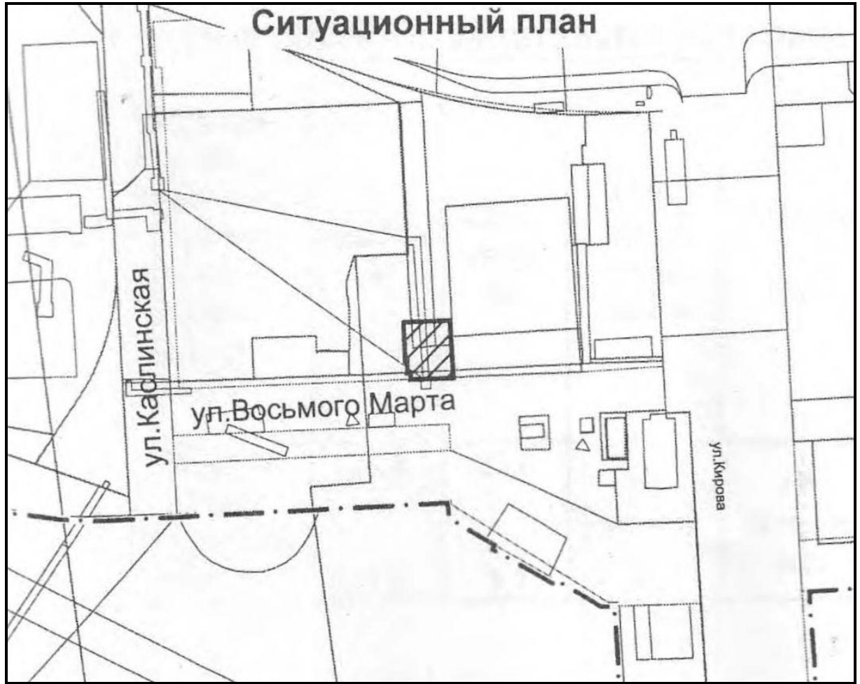
Приложение 2. Ситуационный план размещения объекта.