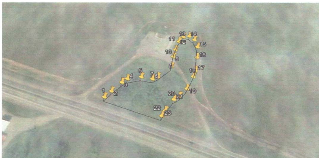
Таблица геоанных к границам лесного участка, Расположенного в Бишкильском участковом лесничестве в квартале 78 выделе 12. (система координат Пулково 1942 зона 11 ГОСТ 51794-2008)